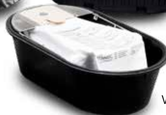
Vak na prachový filter