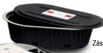
Zásobník na likvidáciu s vekom