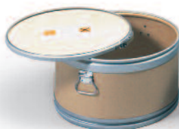
Zbiornik do usuwania pyłu, z pokrywą