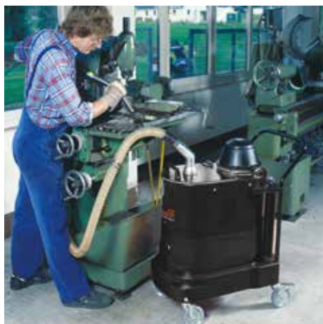
SPS 35, W12 (váltakozó áram)