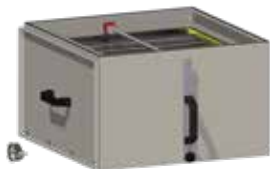
Maradékpor-szűrő 36 m 2