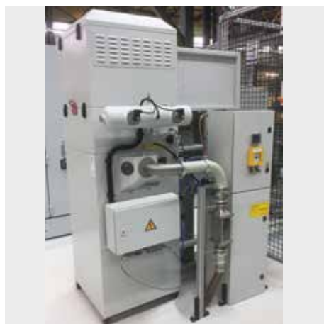
DS 3, M porosztály