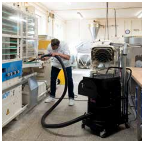
R01 A, L porosztály