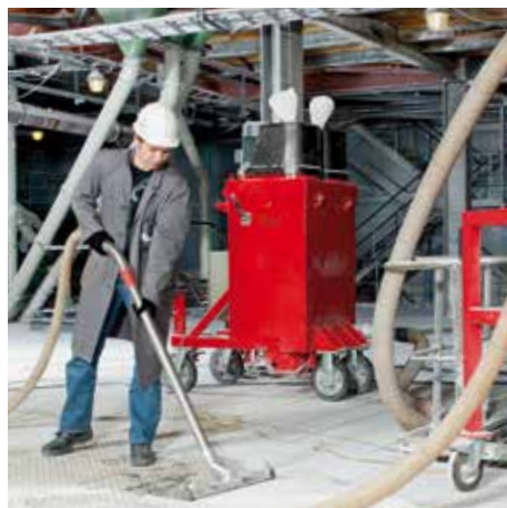
DS 4150, L posztály