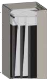
Zsákszűrő 20 m 2