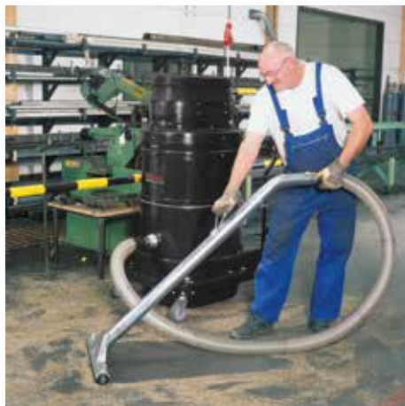
WS 3320, M porosztály