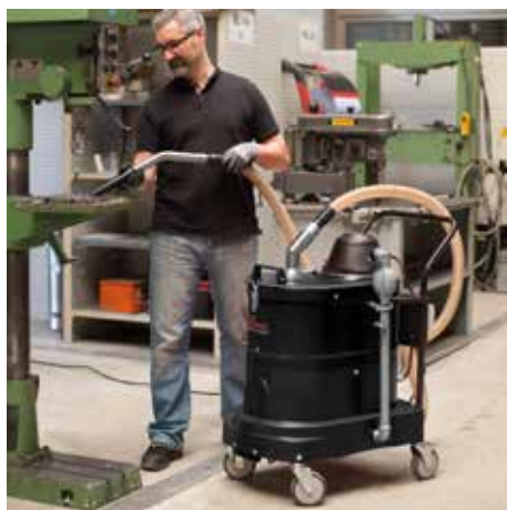
SPS 35, W12 (váltakozó áram)