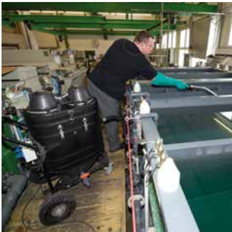
WSP 2000, 85 liter töltési mennyiség