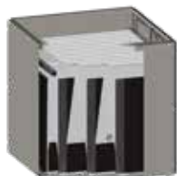
Zsákszűrő 3 m 2 – 10 m 2