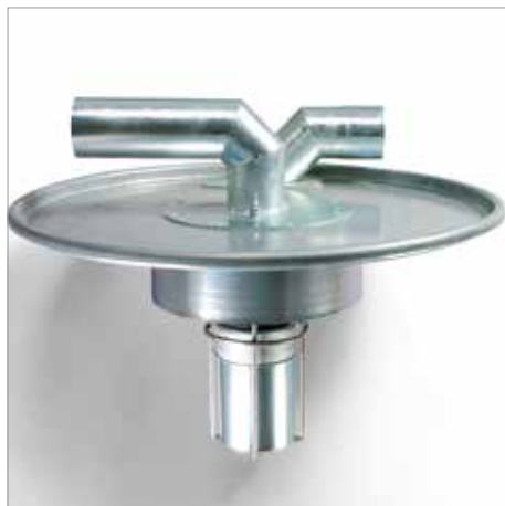
Előválasztó fedél úszóval és demiszter-betéttel