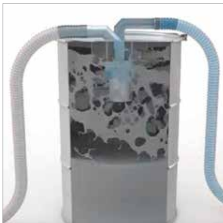
Előválasztó tartály, 200 liter (vágás)