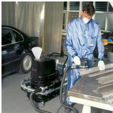
R01 R022 szikracsapdával, M porosztály