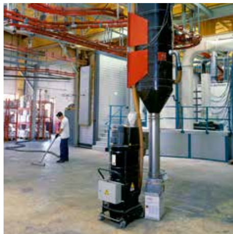
R01 R, silóval, M porosztály