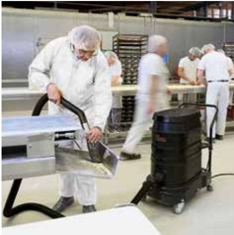
R01 A, M porosztály