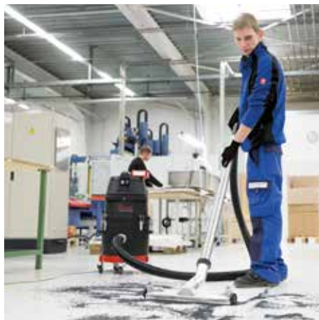
WS 200, H porosztály