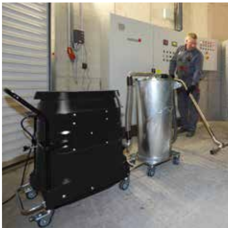
R01 A előválasztó tartállyal, 110 liter