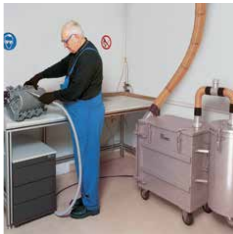
NA 250 maradékpor szűrővel