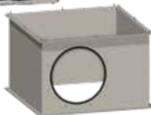
Beáramlási modul 300 m 2