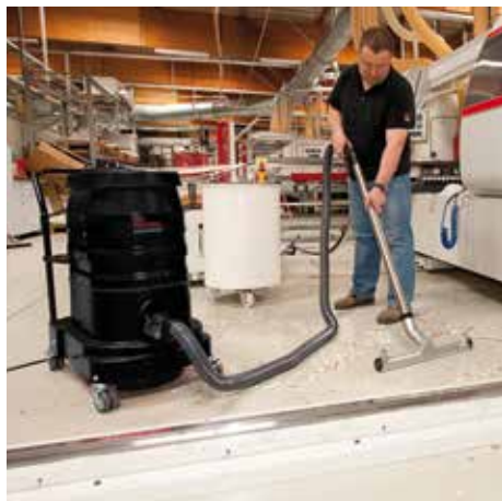
R01 A, L porosztály