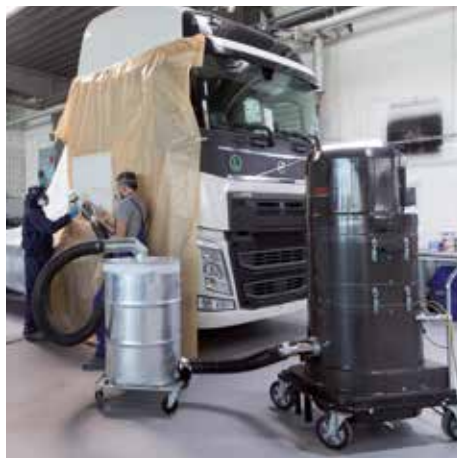
DS 2520, M porosztály