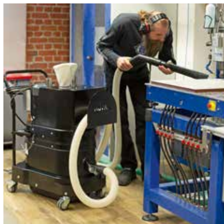
R01 R, L posztály