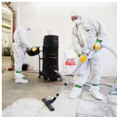
DS 2520, H posztály