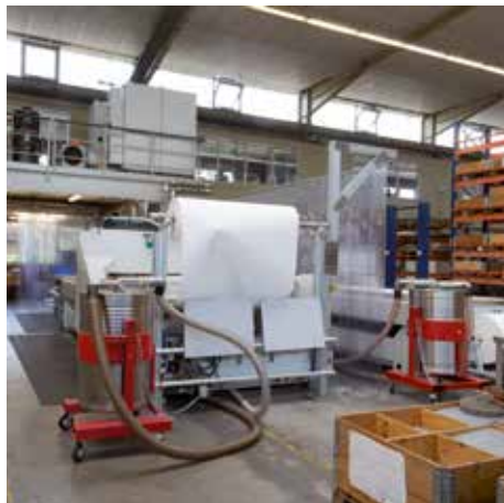
Előválasztó tartály (200 liter) hordóbillentővel