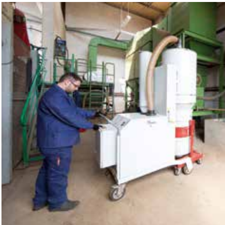
DA 5150, M porosztály