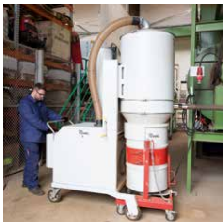
DA 5150, M porosztály, hordóbillentővel