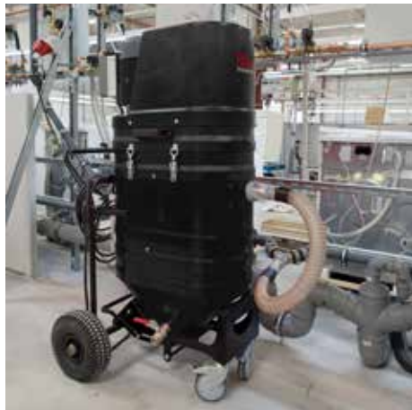
WSP 2000, 100 liter töltési mennyiség