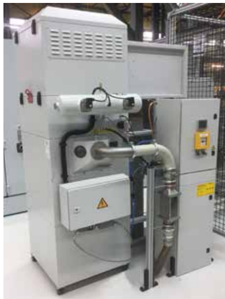
DS 3, M posztály