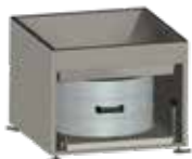
V2A porgyűjtő edény, 55 liter