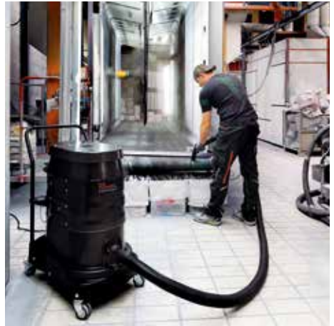
R01 A, M porosztály