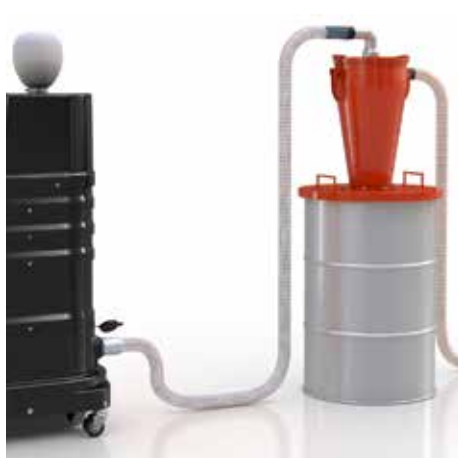
Ciklon az előválasztón R01 R készülékkel