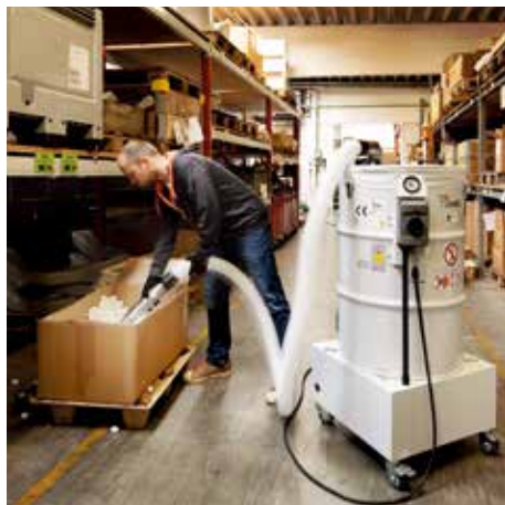
DAV-SB, M porosztály