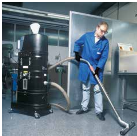
NA 35 - D1

Nedves leválasztó / váltakozó áramú hajtás Reaktív anyagok felszívása