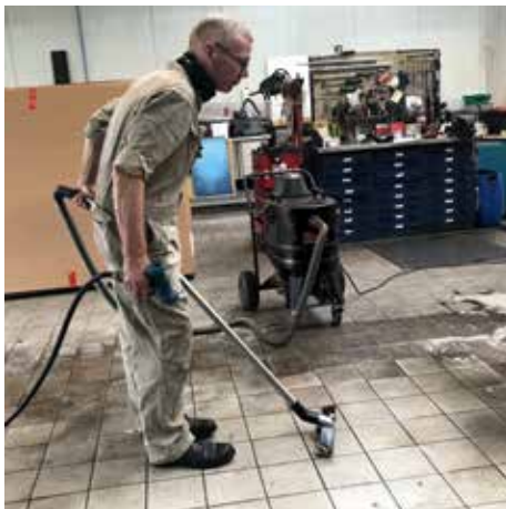
WSP 2000, 45 liter töltési mennyiség