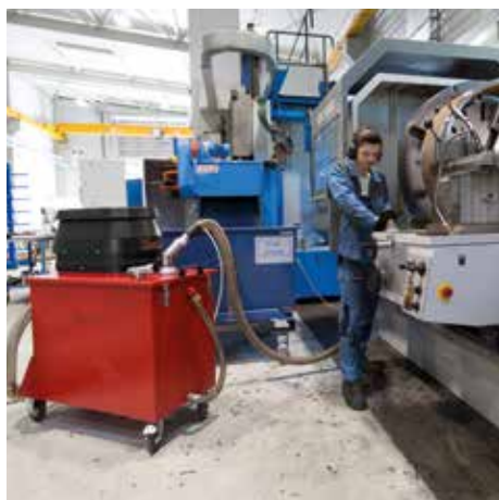
SPS 250, W24 (váltakozó áram)