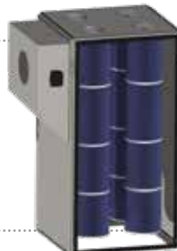
Patronszűrő 24 m 2