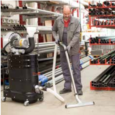
R01 S, H porosztály