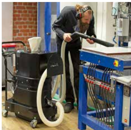
R01 R, M porosztály