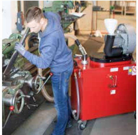
SPS 250-DA 30, M porosztály