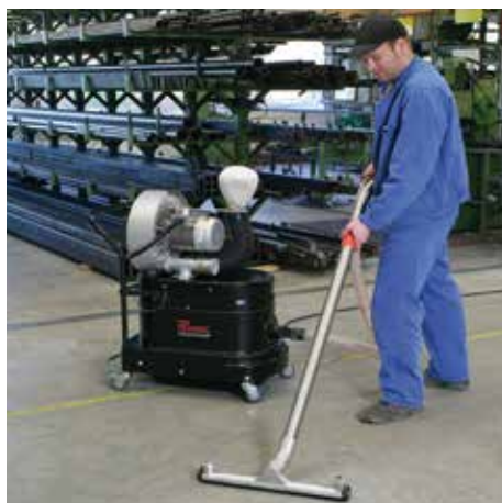
R01 S, M porosztály