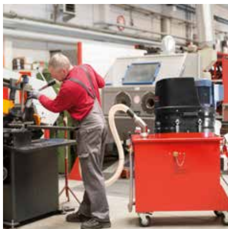
SPS 250, D40 (háromfázisú váltóáram)