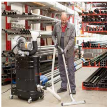
R01 S, L porosztály

Ipari elszívó berendezések / sűrített levegős hajtás