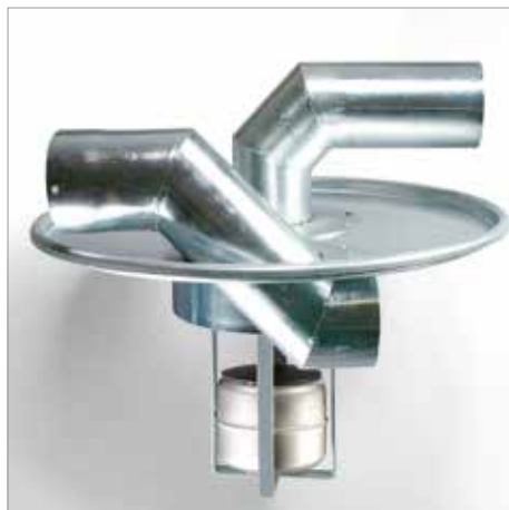
Előválasztó fedél úszóval