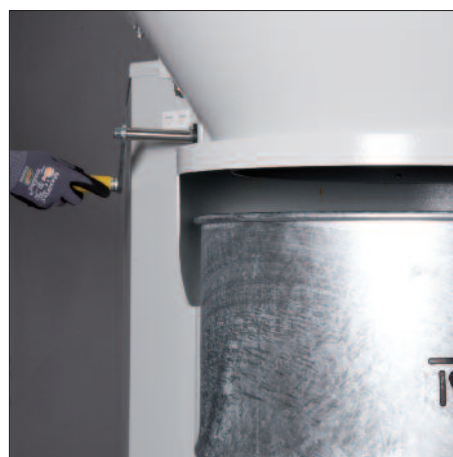
Pontosan hozzáigazítható az aktuális leválasztóegységhez