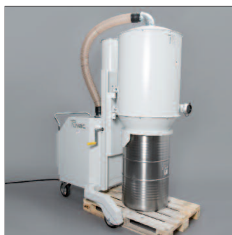
200 literes hordó Euro raklapon