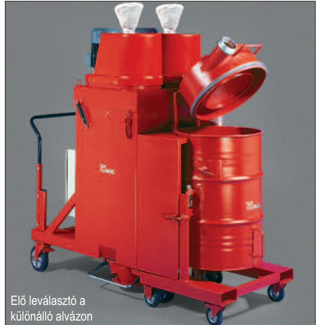
Elő leválasztó a különálló alvázon