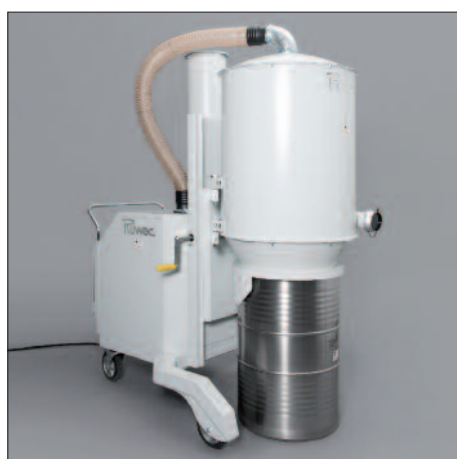
Conteneur de 200 litres