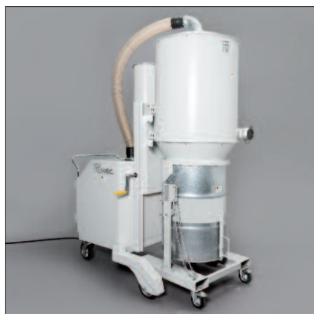
Conteneur de 200 litres avec dispositif de basculement et sacs à gerbeur