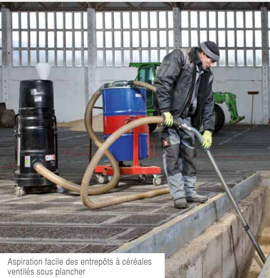
Aspiration facile des entrepôts à céréales ventilés sous plancher