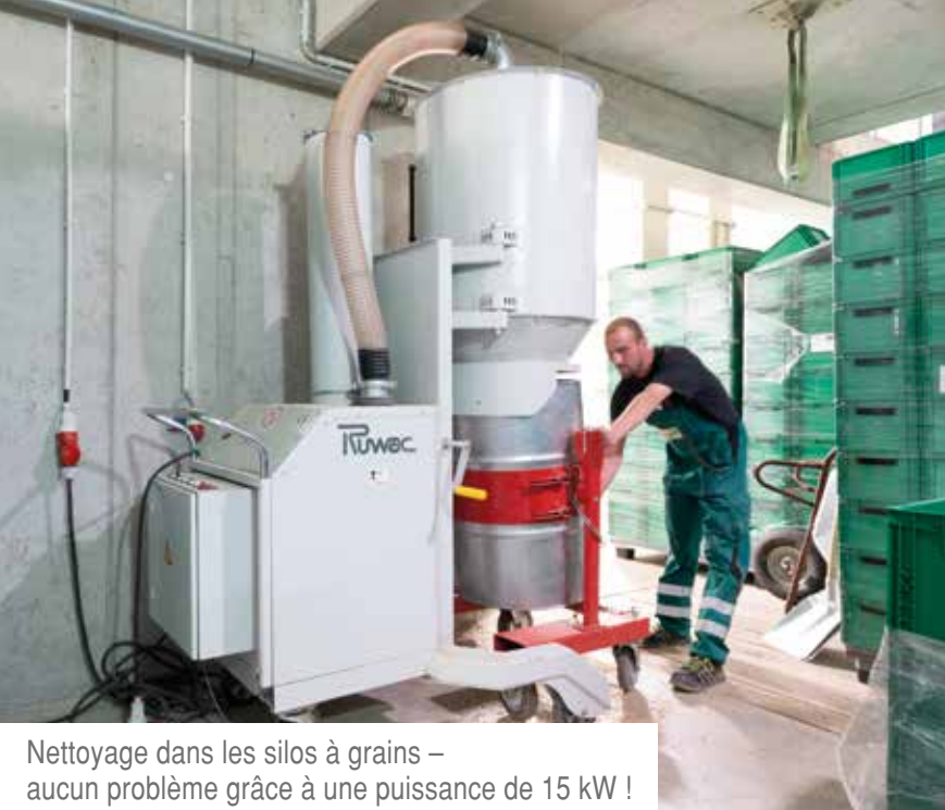
Nettoyage dans les silos à grains – aucun problème grâce à une puissance de 15 kW !