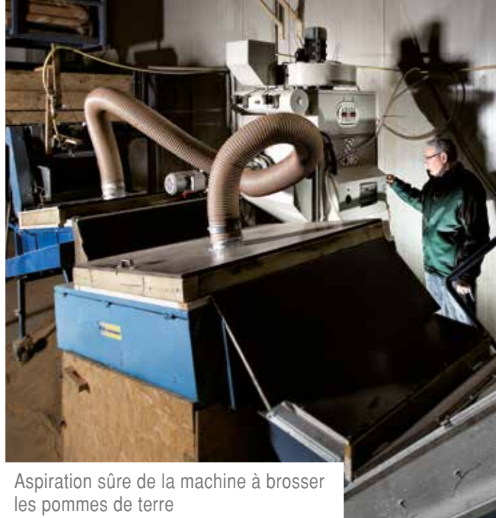
Aspiration sûre de la machine à broser les pommes de terre