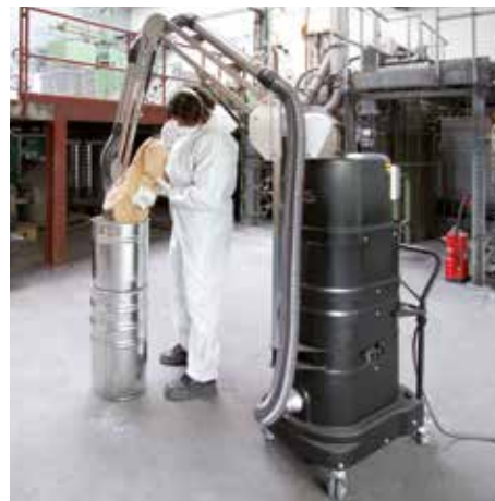
R01 R075 atm. expl. polvo, con brazo aspirador en la producción de plástico