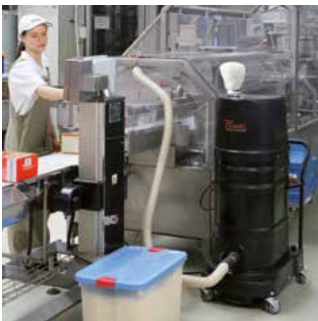
R01 R022 atm. expl. polvo en la producción de alimentos