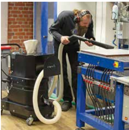
R01 R022 atm. expl. polvo en el procesamiento de madera