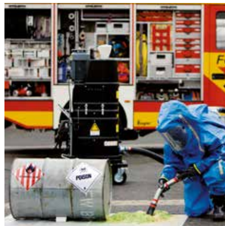
R01 R040 atm. expl. gas en el cuerpo de bomberos