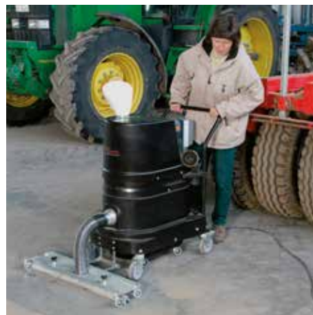
R01 R022 atm. expl. polvo con dispositivo para aspirar el suelo en la industria agraria