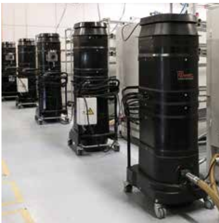
R01 R040 en la fabricación de in placas de circuito impreso