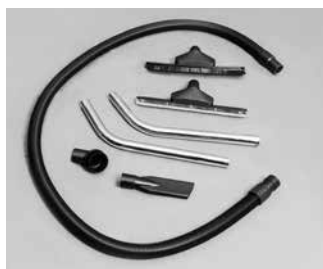
R18 A010 jaoks