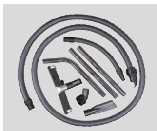
R18 A011 jaoks