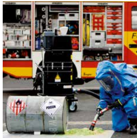
R01 R040 gaasiplahvatuskindel tuletõrje valdkonnas