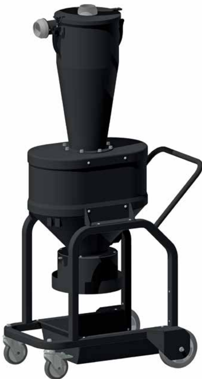
Longopac®-i väljalaskeavaga tsüklon