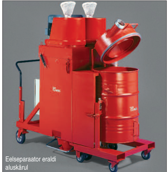
Eelseparaator eraldi aluskärol