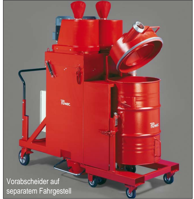
Vorabscheider auf separatem Fahrgestell