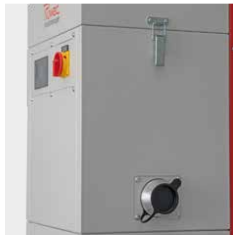
Position des Sauganschlusses (rechts / links) wählbar