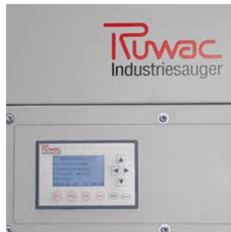
Steuerung mit unterschiedlichen Funktionen