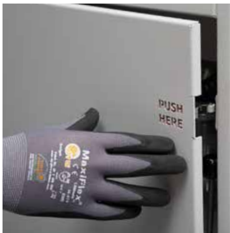
Einfache Öffnung der Klappe zum Longopac®-System