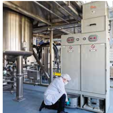
DS 65600 in der kosmetischen Industrie