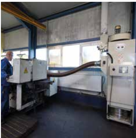
DS 63000 in der Metallverarbeitung