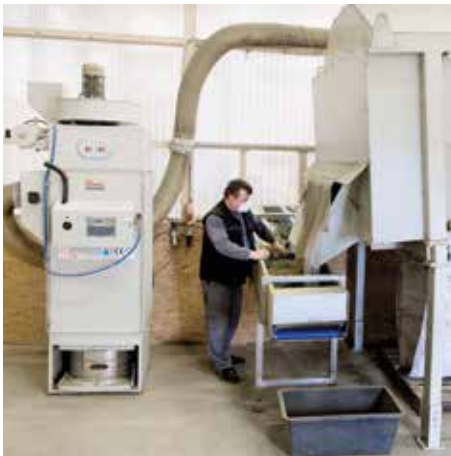
DS 64400 in der Tiernahrungs- verarbeitung