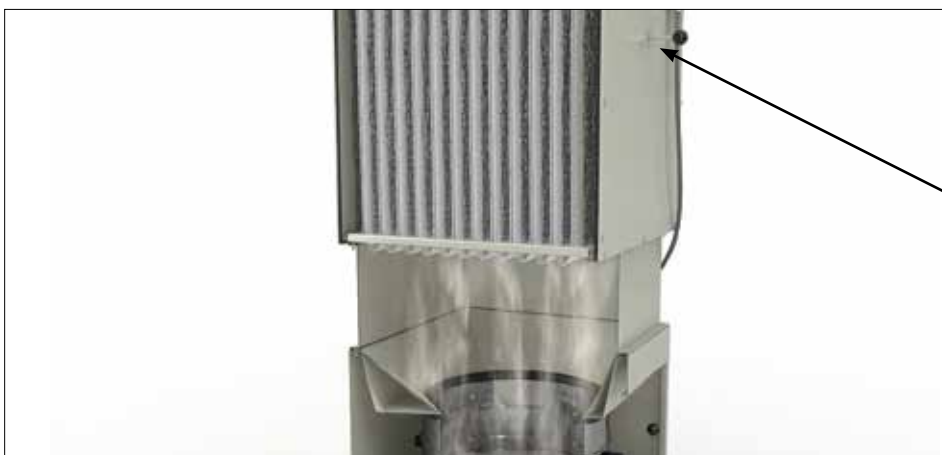
DS 6 effektive Handabreinigung