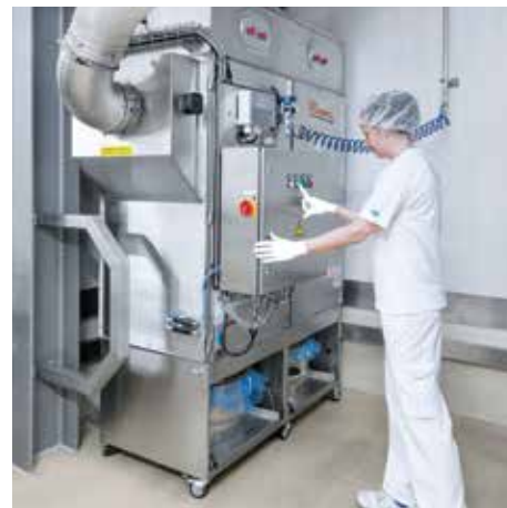
DS 64000 in der Lebensmittel- verarbeitung