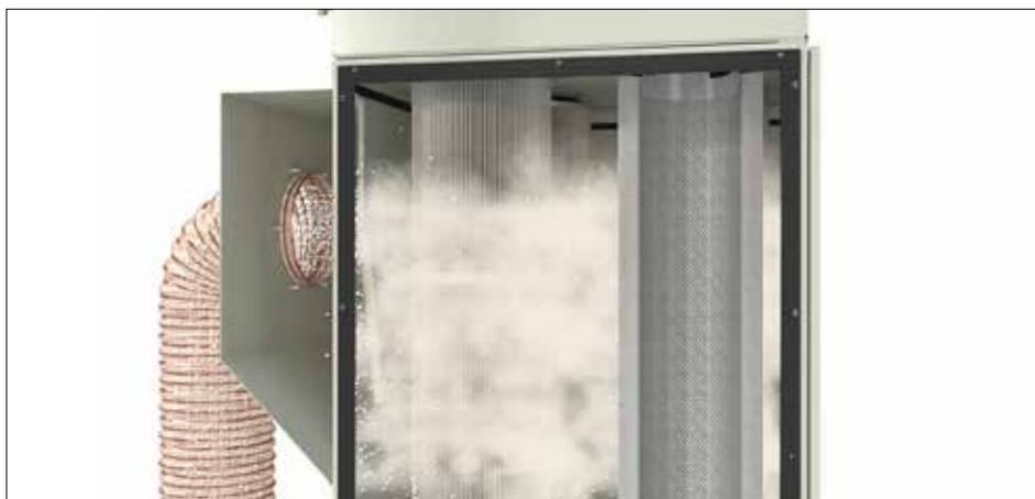
DS 6 mit differenzdruckgesteuerte Druckluft-Abreinigung