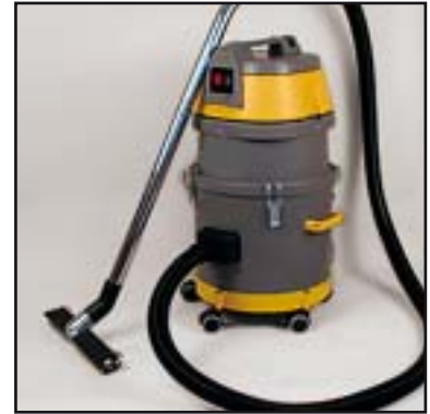
WS 200 mit Zubehör