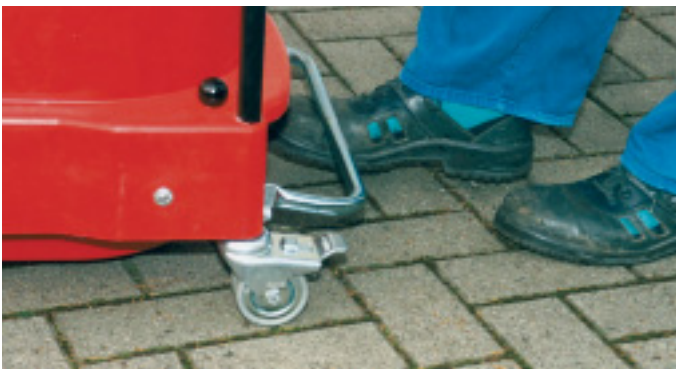
Leichteste "Handhabung" durch Fußhebelentleerung